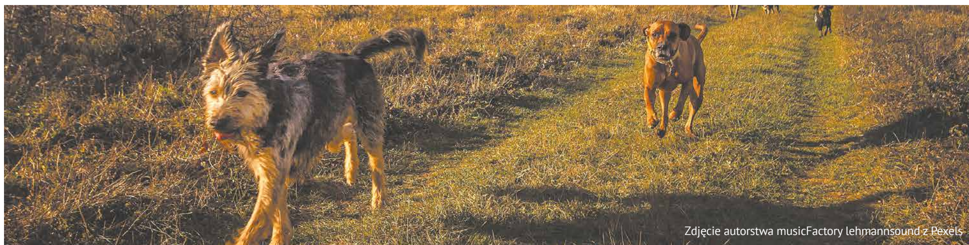
Zdjęcie autorstwa musicFactory lehmannsound z Pexels